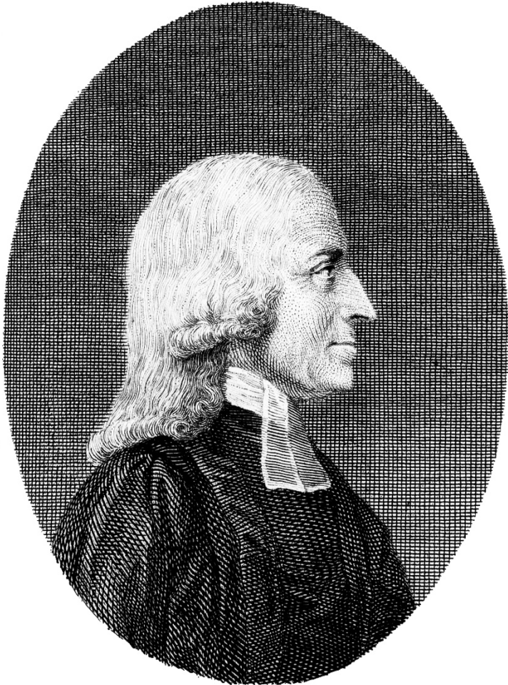
Grabado de Juan Wesley, por William Bromley (1791).